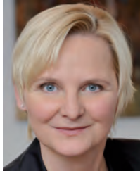
Sandra Frauenberger Wiener Stadträtin für Frauenfragen und Antidiskriminierung

Trotz aller gesetzlichen und gesellschaftspolitischen Fortschritte ist es für Lesben noch immer nicht leicht, sich am Arbeitsplatz zu „outen“ – zu hoch erscheint vielen das Risiko. Denn Lesben werden im Berufsleben oft doppelt diskriminiert: Zum einen sind sie den „typischen“ Ungleichbehandlungen als Frau ausgesetzt; sie werden also etwa auf Grund ihres Geschlechts schlechter entlohnt oder haben beschränkte Aufstiegschancen. Zum anderen laufen Lesben auch Gefahr, aus homophoben Gründen diskriminiert zu werden. Für lesbische Frauen ist die „gläserne Decke“ also noch einmal so dick – und sie zu durchbrechen, ist ganz besonders schwer. Auf jeden Fall ist es für Lesben daher hilfreich, die gesetzlichen Bestimmungen zum Thema Antidiskriminierung zu kennen. Denn nur wer seine Rechte kennt, kann sich gegen Unrecht wehren.